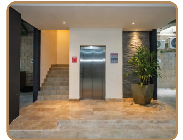
Elevador para 6 personas