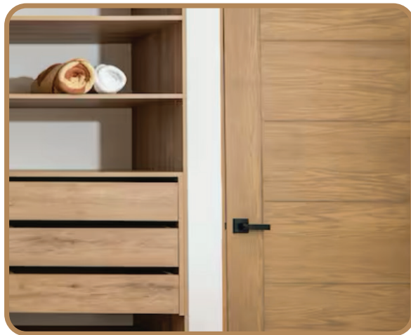
Puertas de producción alemana de 16 mm