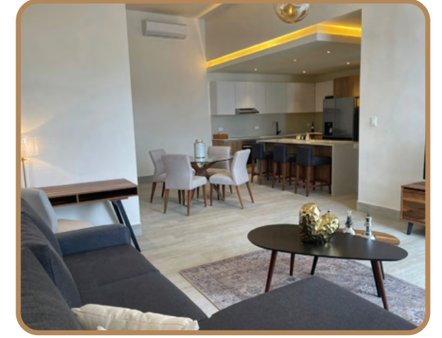
Iluminación LED Luz indirecta