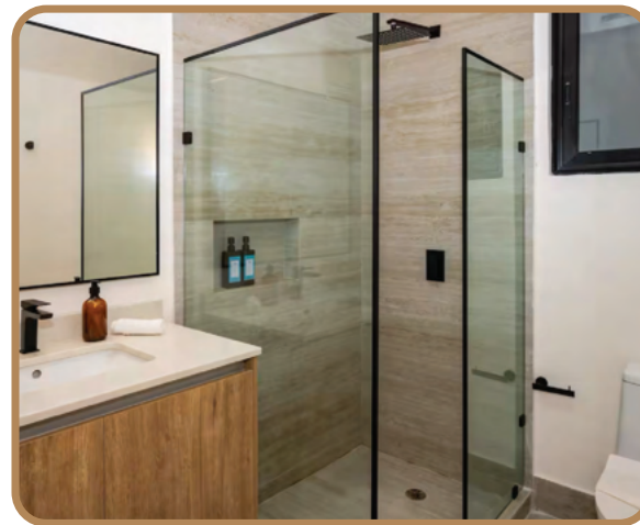
Canceles de baño en cristal templado de 9.5 mm