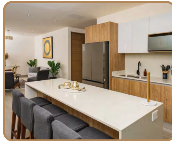
Cubiertas de cuarzo en mesetas y lavabos