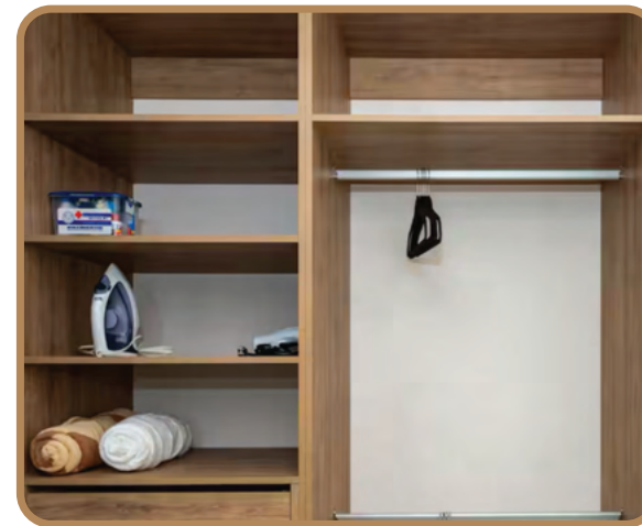
Closets de producción alemana marca Rehau Rauvisio