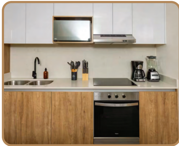
Cocinas de producción alemana marca Rehau Rauvisio