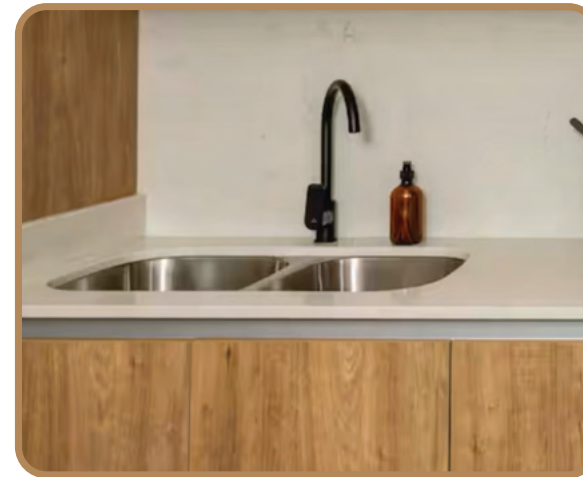
Griferías y accesorios Helvex / Tarjas y estufa TEKA